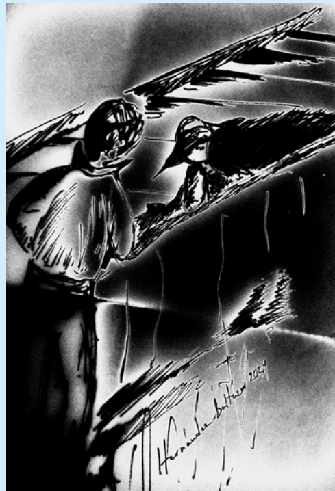
IMAGEN: Empatía Autor: Daniel Hernández Baltazar / Tinta sobre papel. Instituto de Neurootología, Universidad Veracruzana.

Migrar por un trabajo digno, no debería ser una condena. Nadie debería sufrir hambre, discriminación, violencia o explotación por cruzar una frontera. Los trabajadores migrantes no son delincuentes ni enemigos, son personas que merecen respeto y trato digno. Como sociedad, necesitamos cambiar la forma en que los miramos, desde la empatía y la solidaridad. Proteger sus derechos no es un acto de caridad, es una obligación ética y legal. Si queremos un mundo más justo, no podemos cerrar los ojos ante el dolor que ocurre en el tránsito migratorio. Es necesario cambiar la narrativa de que las personas migrantes son delincuentes, debemos promover que tienen derechos al igual que todos, con historias, sueños y necesidades humanas. Reconocer la migración laboral como un ejercicio de derechos implica una transformación profunda. Supone que los Estados garanticen rutas seguras, acceso a servicios básicos, oportunidades laborales dignas y políticas de integración reales. También demanda que la sociedad civil, los medios de comunicación y los espacios educativos promuevan una visión ética, empática y basada en la justicia social. Migrar por trabajo, en particular, debe poder ser una opción libre, digna y protegida. Para lograrlo, necesitamos revisar las causas estructurales que obligan a millones a desplazarse y garantizar condiciones reales de justicia y equidad para quienes deciden hacerlo.